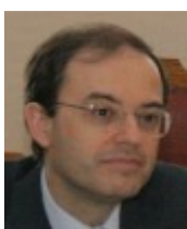
Secretario (con voz y sin voto)

Es licenciado en Filosofía por la Universidad de Alcalá de Henares, en Teología y en Biología por la de Granada, y Master en Genética por la de California (USA). Es doctor en Ciencias y profesor de Investigación ad honorem del Centro de Biología Molecular del Consejo Superior de Investigaciones Científicas en la Universidad Autónoma de Madrid. Ha participado en numerosos comités nacionales e internacionales sobre bioética.